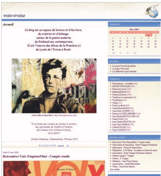
Voix iroise, le blog poétique des élèves de 1 re L de Jean-Michel Lebaut.