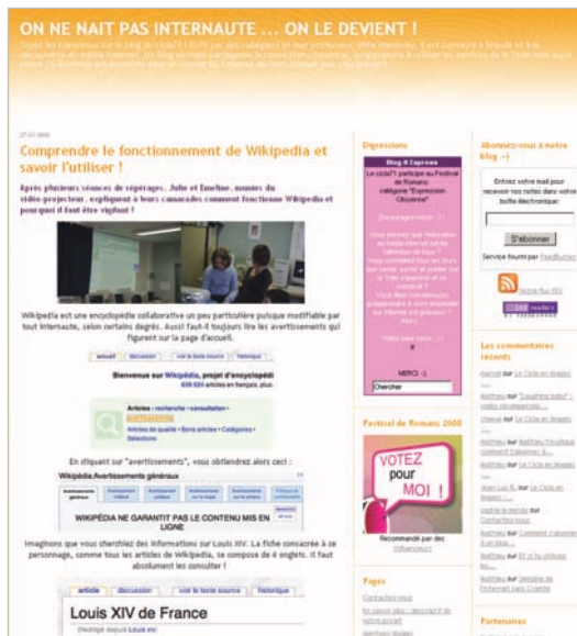
On ne naît pas internaute, on le devient, un blog d'éducation aux médias réalisé par des collégiens, avec Christelle Membrey.